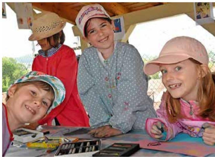
Heureuses, les écolières de Rueyres-les-Prés à l'atelier Peinture!